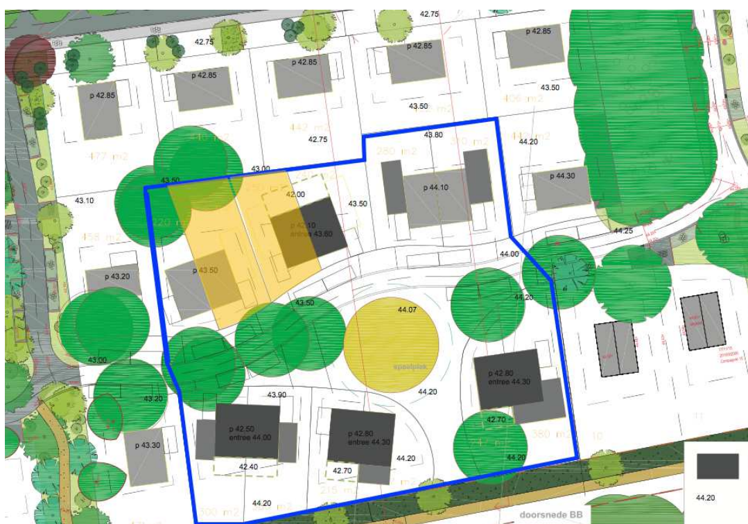
Figuur: De verkaveling van Boddegat 2.0.

In dit Boddegat 2.0 bouwen we alleen woningen, allen twee-onder-één-kappers. Het openbaar gebied, met een speelplek rondom de beuk, blijft eigendom van de gemeente en wordt door de gemeente ingericht. Wel is de verkaveling in overleg met ons gemaakt met uiteindelijk dit fantastische resultaat (figuur onder).