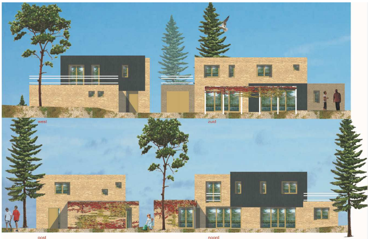
Figuur: Impressie van een Boddegat 2-onder-1 kapwoning. Met de klok mee: aanzicht vanuit west, zuid, noord en oost.

De basis van de woningen bestaat uit twee woonlagen van 6 x 10 meter en een berging. Om de woning voor elk huishouden op maat te maken, is er een lijst met mogelijke accessoires. Denk bijvoorbeeld aan de mogelijkheid om een dakopbouw toe te voegen, naar achteren of opzij uit te bouwen of bijvoorbeeld de berging te vervangen door een garage. De woningen worden onder architecteur gebouwd, waardoor ze er mooi uit gaan zien, het een goed geheel wordt dat past in het landschap.